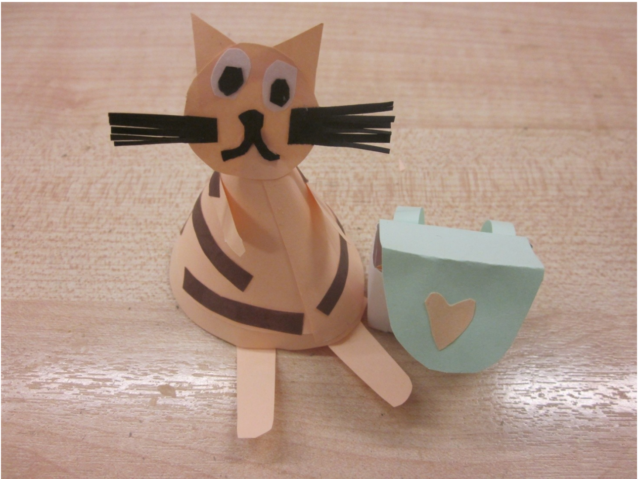
Иллюстрация № 1